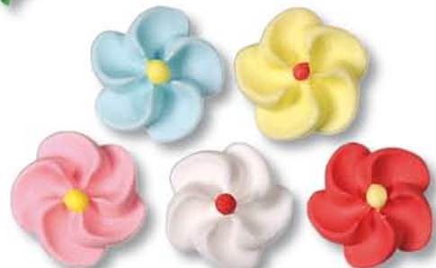
ED10004 - Suiker Madeliefje 20 mm. € 34,50 / 560 st.