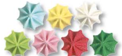
ED10007 - Suiker Madeliefje 10 mm. € 26,95 / 1 kg.