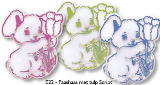
E22 - Paashaas met tulp Script € 15,53 / 36st.