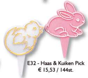
E32 - Haas & Kuiken Pick € 15,53 / 144st.