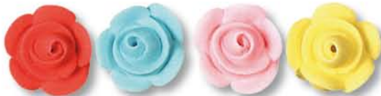
ED10021 - Suiker Roos assorti € 46,50 / 192 st. (Ø 25 mm.)