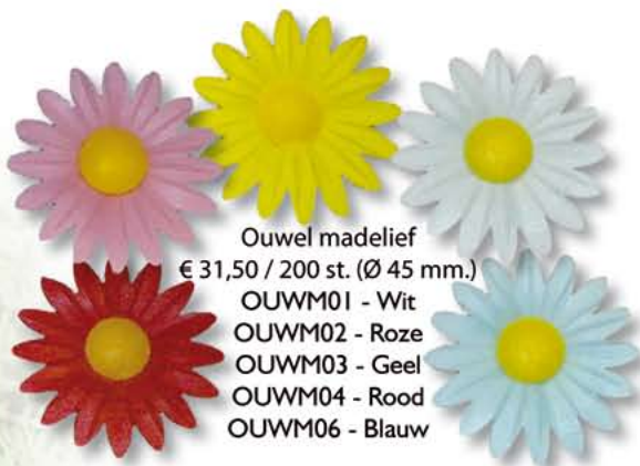
Ouwel madelief € 31,50 / 200 st. (Ø 45 mm.) OUWM01 - Wit OUWM02 - Roze OUWM03 - Geel OUWM04 - Rood OUWM06 - Blauw