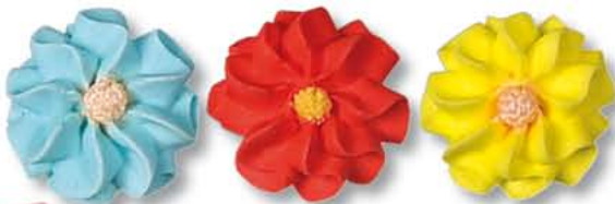
ED10014 - Suiker Madeliefje 25 mm. € 39,50 / 200 st.