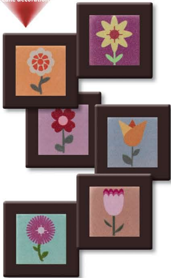
CH99931 - Chocolade Assortie Pasen € 35,95 / 240 st. (38 x 38 mm.)