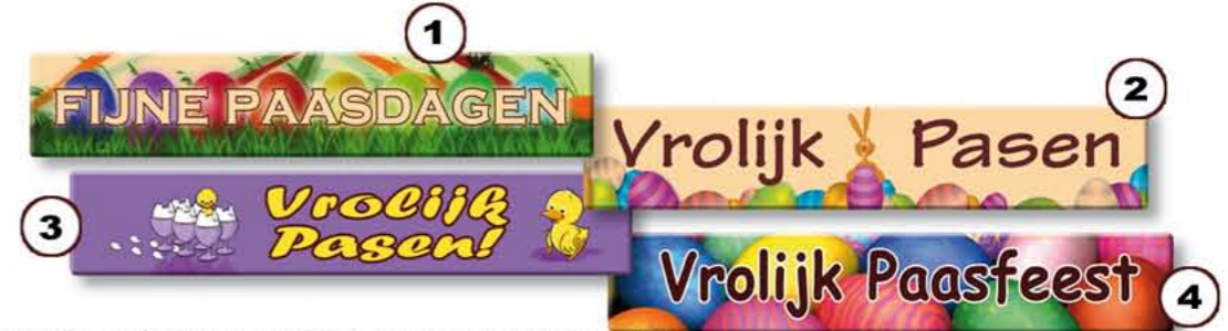
CH99964-PASEN Strip (80 x 15 mm) ± € 0,18 / st. (min. afname 288 st.)

Vermeld a.u.b. het betreffende schildnummer (of een combinatie van de nummers) bij de bestelnummers CH99961-PASEN, CH99964-PASEN en/of CH99992-PASEN.