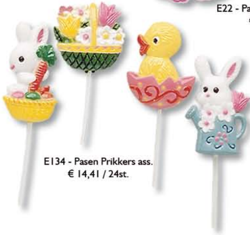
E134 - Pasen Prikkers ass. € 14,41 / 24st.