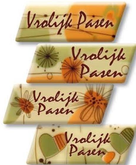
CH99932 - Chocolade Assortie Pasen € 51,48 / 240 st. (65 x 22 mm.)