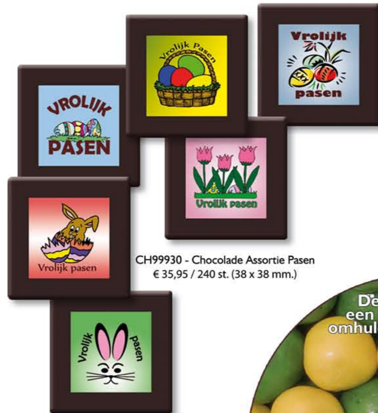
CH99930 - Chocolade Assortie Pasen € 35,95 / 240 st. (38 x 38 mm.)