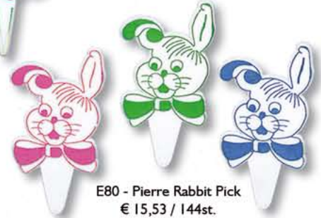
E80 - Pierre Rabbit Pick € 15,53 / 144st.