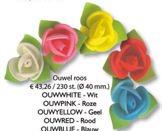
Ouwel roos € 43,26 / 230 st. (Ø 40 mm.) OUWWHITE - Wit OUWPINK - Roze OUWYELLOW - Geel OUWRED - Rood OUWBLUE - Blauw