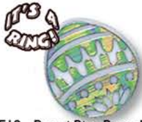
E19 - Paasei Ring Regenboog € 14,41 / 144st.