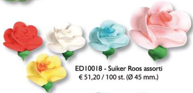
ED10018 - Suiker Roos assorti € 51,20 / 100 st. (Ø 45 mm.)