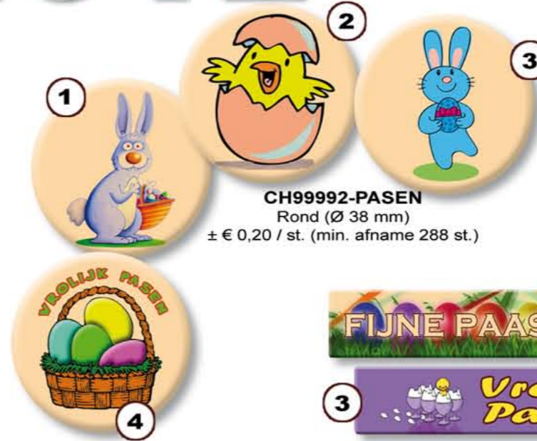
CH99992-PASEN Rond (Ø 38 mm) ± € 0,20 / st. (min. afname 288 st.)