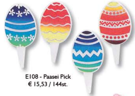
E108 - Paasei Pick € 15,53 / 144st.