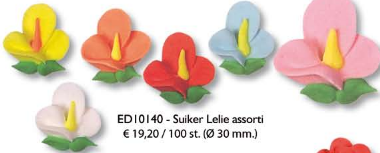
ED10140 - Suiker Lelie assorti € 19,20 / 100 st. (Ø 30 mm.)