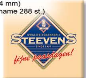
CH99994 Vierkant (38 mm) ± € 0,21 / st. (min. afname 288 st.)

Parelcrispies zijn krokante granen omhuld met witte chocolade. Ze hebben een zachte en krokante bite.