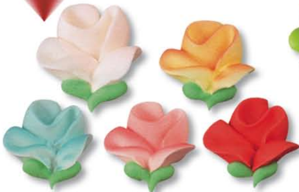
ED10087 - Suiker Tulp assorti € 35,75 / 144 st. (Ø 35 mm.)