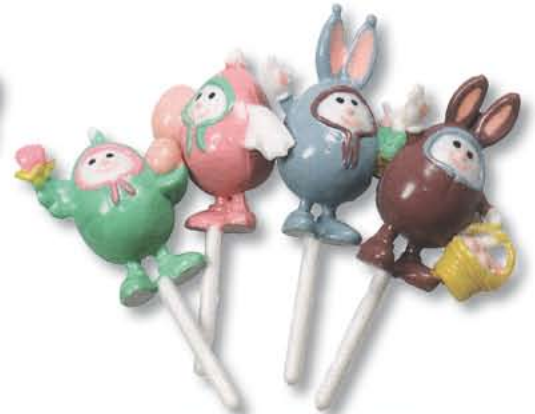
100710 - Kinderpaaseiprikker € 27,50 / 144st.