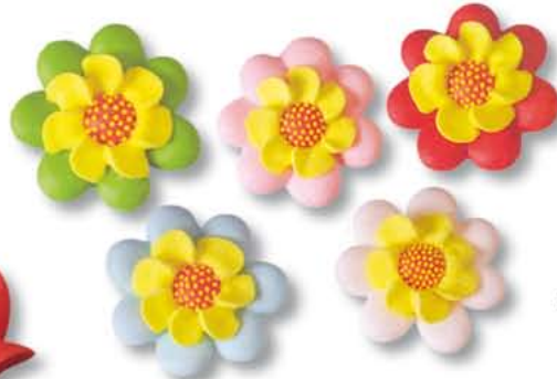
ED10141 - Suiker Campanula assorti € 39,60 / 120 st. (Ø 35 mm.)