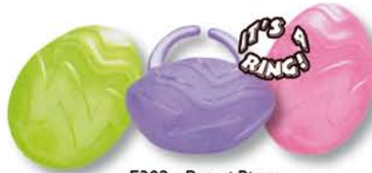
E302 - Paasei Ring € 16,64 / 144st.