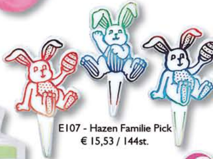
E107 - Hazen Familie Pick € 15,53 / 144st.