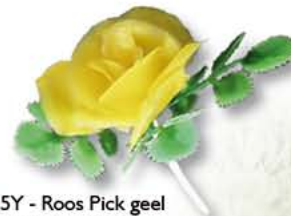
F55Y - Roos Pick geel € 14,41 / 144st.