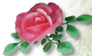
F55P - Roos Pick Roze € 14,41 / 144st.