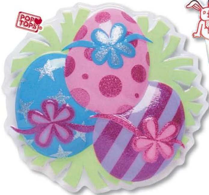
E122 - Paasei Glitter PopTop € 12,19 / 24 st.