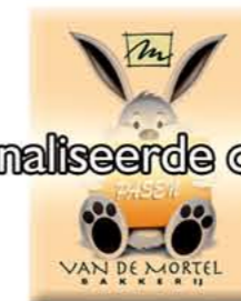
CH99993 Rechthoek (38 x 30 mm) ± € 0,20 / st. (min. afname 288 st.)

Gepersonaliseerde chocoladeschildjes met Uw eigen logo?