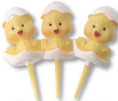
100753 - Kuiken met eierschaalhoed op prikker € 20,82 / 144st.