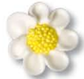
ED10101 - Suiker Madeliefje wit € 45,25 / 280 st. (Ø 23 mm.)