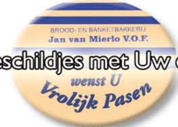
CH99991 Ovaal (44 x 34 mm) ± € 0,20 / st. (min. afname 288 st.)