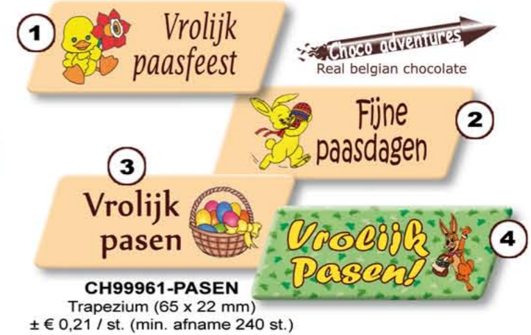
CH99961-PASEN Trapezium (65 x 22 mm) ± € 0,21 / st. (min. afname 240 st.)