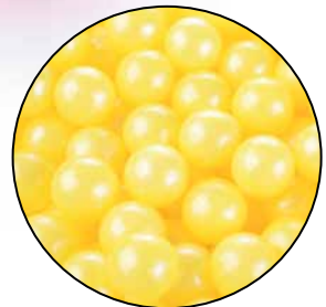
Suiker Parels Geel Code: ED 25680E