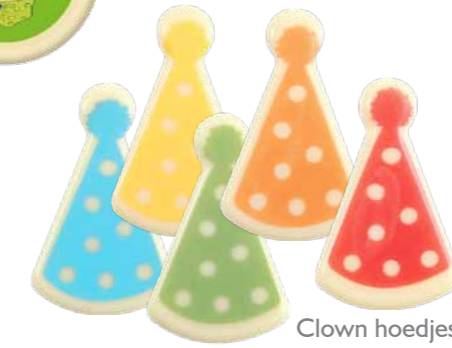
Clown hoedjes Code: CH 24275 CM: 4,5 x 3 120 stuks - Chocolade € 19,40