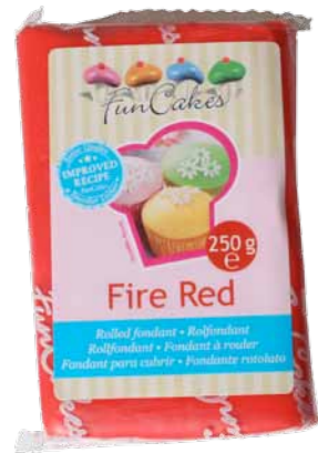
Fire Red FC 97350 - 250 gr - € 2,00 FC 97360 - 1000 gr - € 6,80