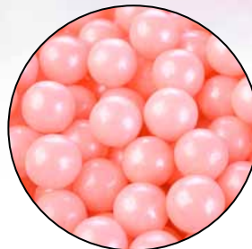
Suiker Parels Roze Code: ED 25680B