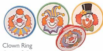
Clown Ring Code: C 56 CM: Ø 4 144 stuks - Plastic € 9,40