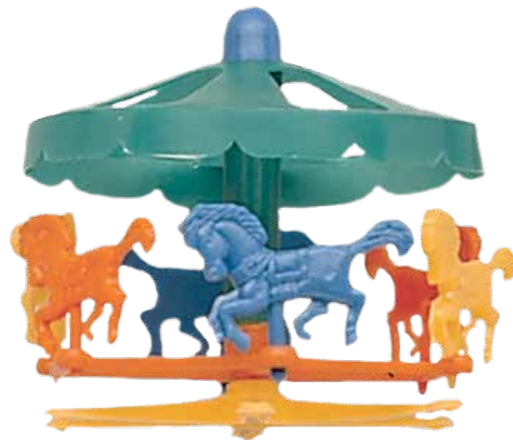
Carrousel Code: C 585 CM: 8 12 stuks - Plastic € 6,17