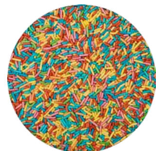
Chocolade Hagelslag Code: ED 3090-MIX MM: 3 - 6 2000 gr. € 26,20