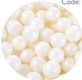
Suiker Parels Wit Code: ED 25680G