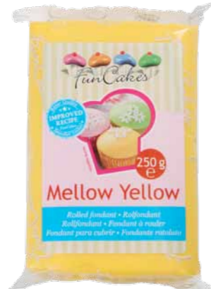
Mellow Yellow FC 97600 - 250 gr - € 2,00 FC 97610 - 1000 gr - € 6,80