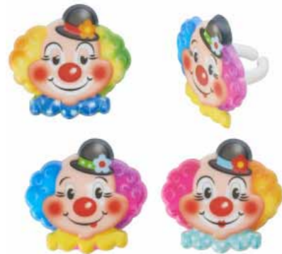
Clown Ring Code: C19318 CM: 4 144 stuks - Plastic leverbaar medio februari