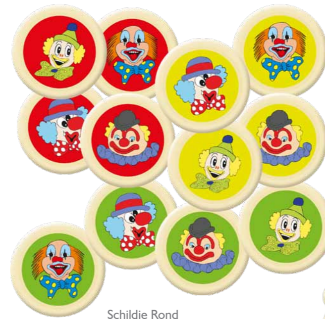
Schildje Rond Code: CH 66097 CM: Ø 3,8 144 stuks - Chocolade € 31,68