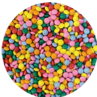
Choco Smarties Code: ED 11132 MM: Ø 9 2000 gr. € 23,10