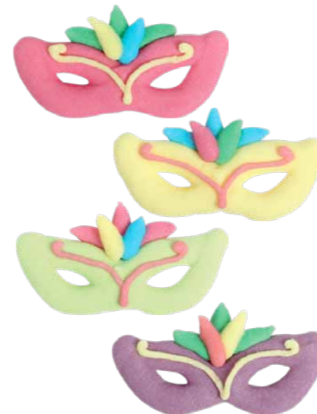
Masker Code: ED 24272 CM: 3,5 x 2 160 stuks - Suiker € 48,46