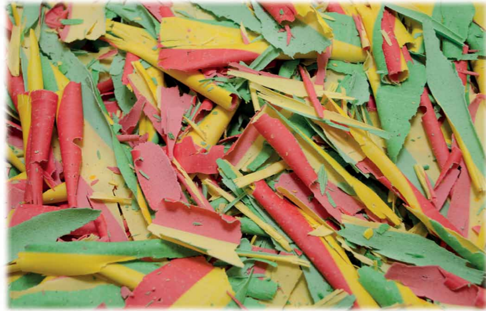
Chocolade Schaaftel Code: DS30 - CARNAVAL 2000 gr. - Witte gekleurde chocolade € 21,95