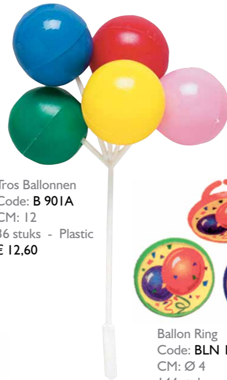
Tros Ballonnen Code: B 901A CM: 12 36 stuks - Plastic € 12,60