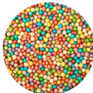
Chocolade Parel Crispy Code: ED 1090-MIX MM: Ø 3 1500 gr. € 25,15