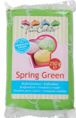
Spring Green FC 97300 - 250 gr - € 2,00 FC 97310 - 1000 gr - € 6,80