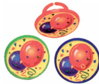
Ballon Ring Code: BLN 1 CM: Ø 4 144 stuks - Plastic € 10,44