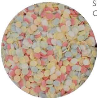
Suiker Confetti Code: CONSEQ MM: Ø 4 1500 gr. € 25,20