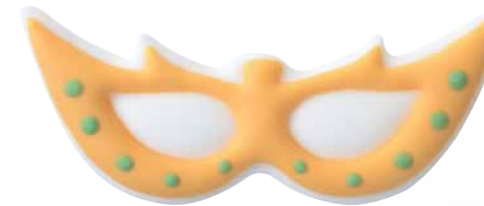
Masker Code: ED 17034 CM: 6,3 x 2,5/3 40 stuks - Suiker € 37,33