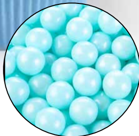
Suiker Parels Blauw Code: ED 25680C

MM: Ø 10 1000 gram - Suiker GLUTEN VRIJ € 13,95